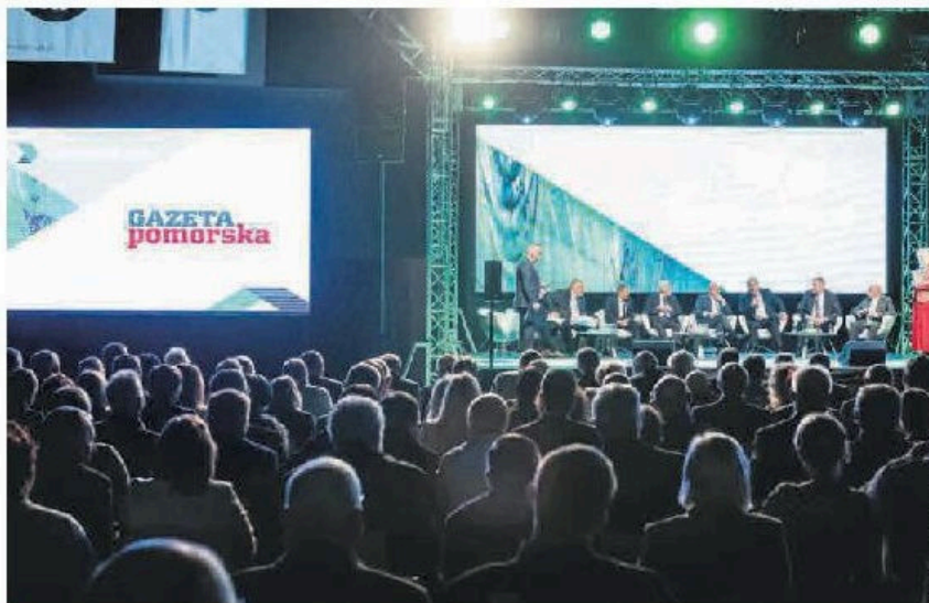
► Tym razem w debacie wzięło udział aż ośmiu ministrów. Dyskutowali na temat zmian we Wspólnej Polityce Rolnej po 2020 roku i tego, czy problemy UE odbiją się na sytuacji polskich rolników